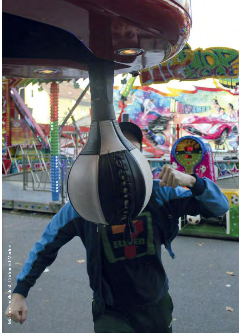
Martener Volkstheater, Dortmund-Martener