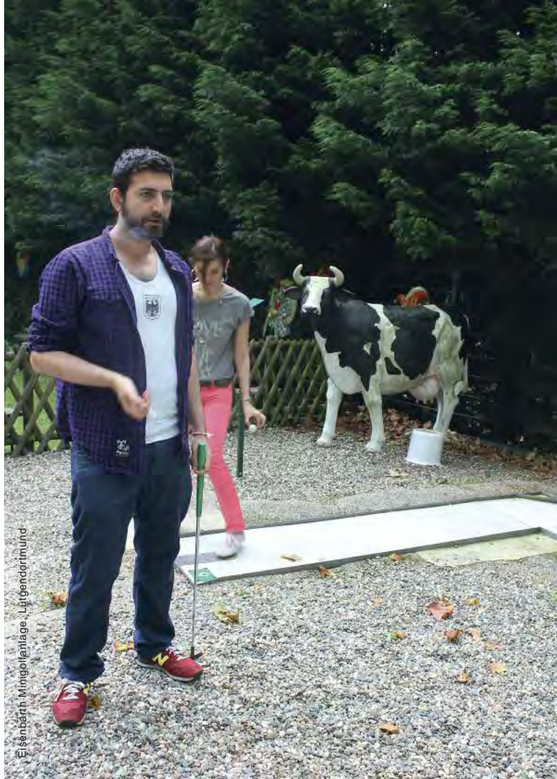
Eisenbärth Mingollarlage, Jugendortmund