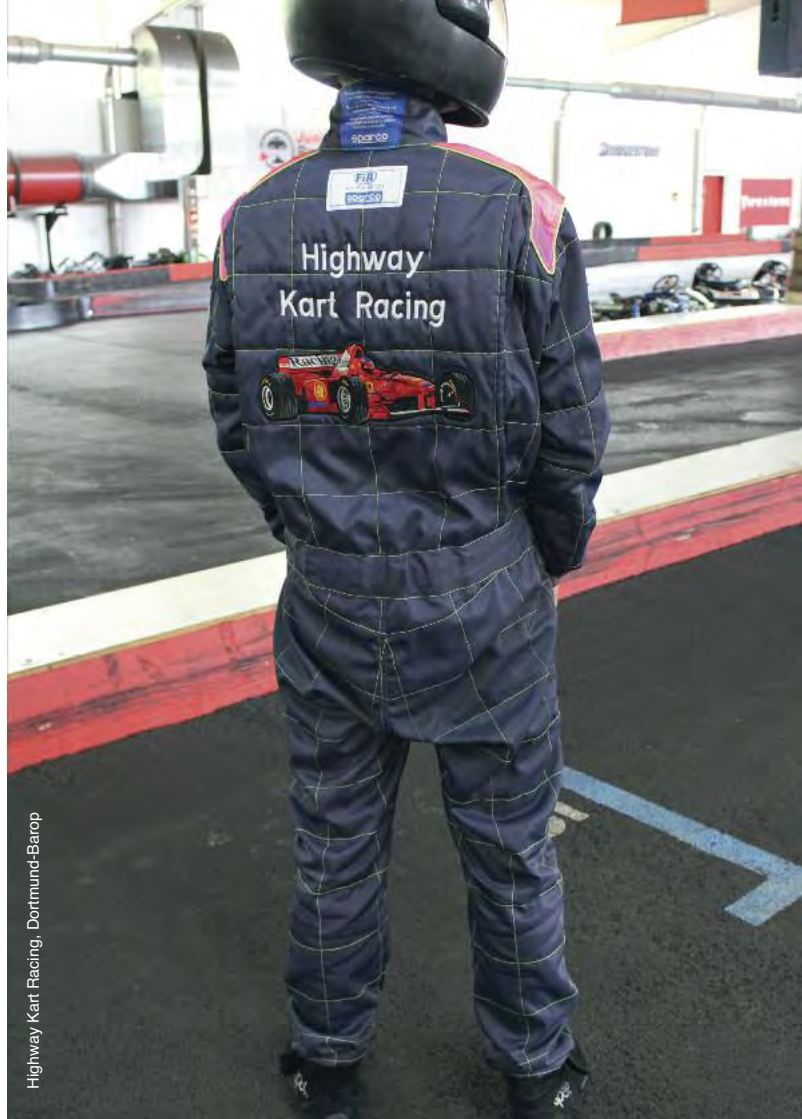
Highway Kart Racing, Dortmund-Barop