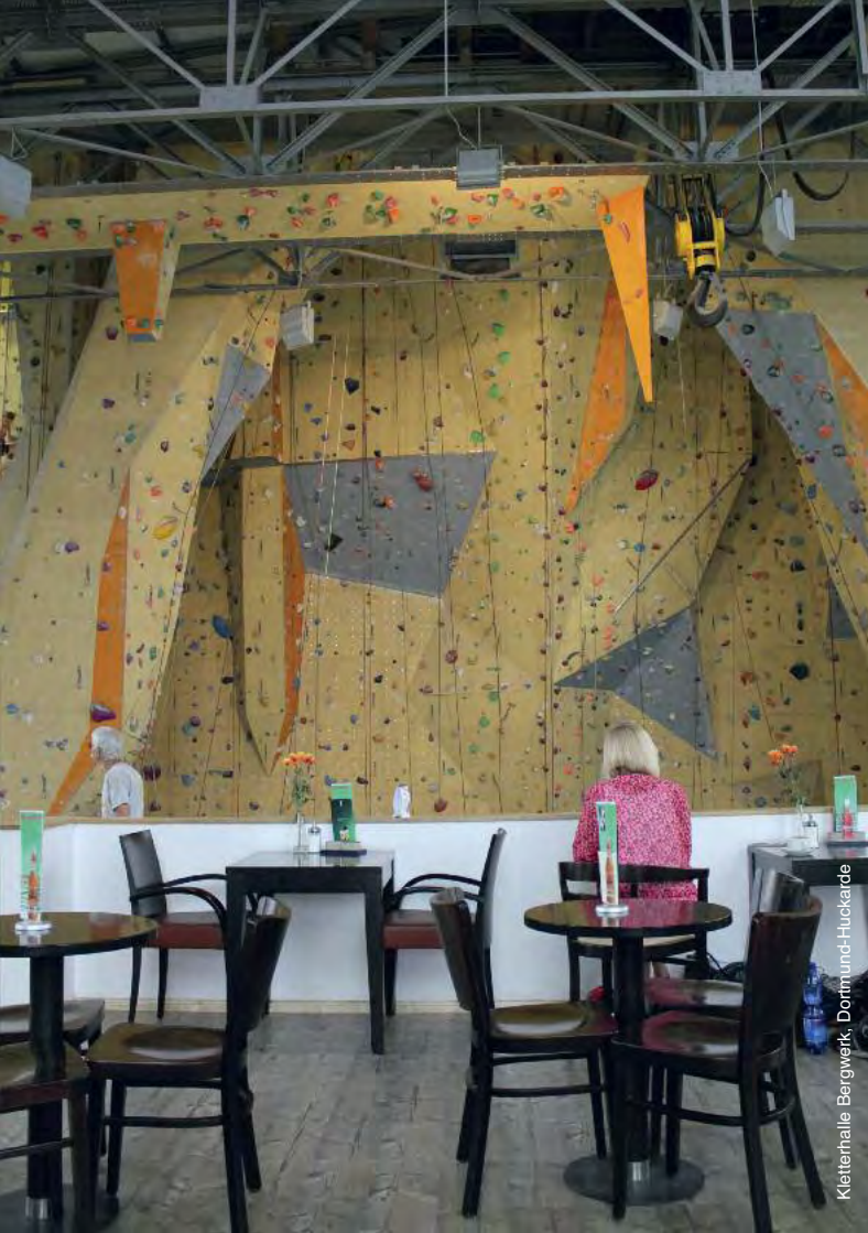
Kletterhalle Bergwerk, Dormund-Huckarde