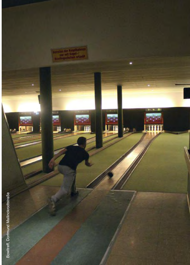
Bowitref, Dortmund Mallinckrodtstraße