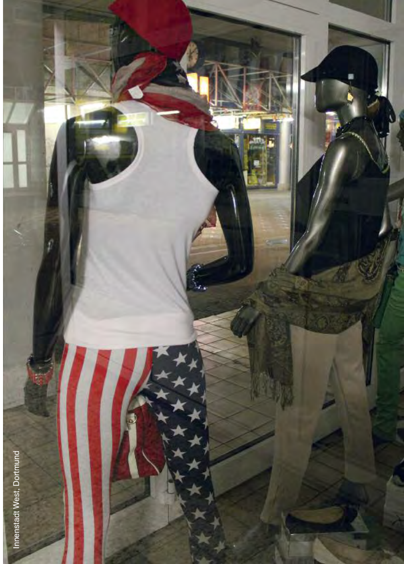
Innenstadt West, Dortmund