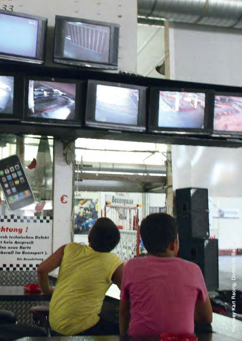
Highway Kart Racing, Dortmund/Barlopp