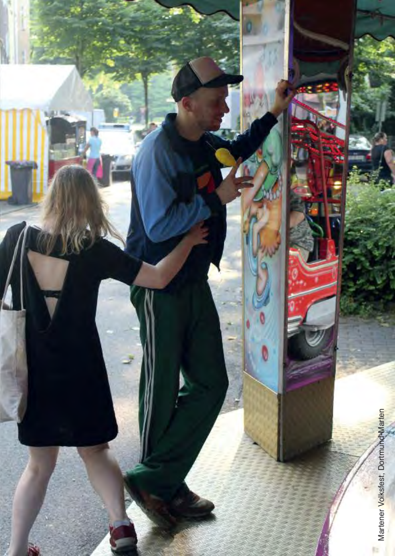
Martener Volksfest, Dortmund-Martien