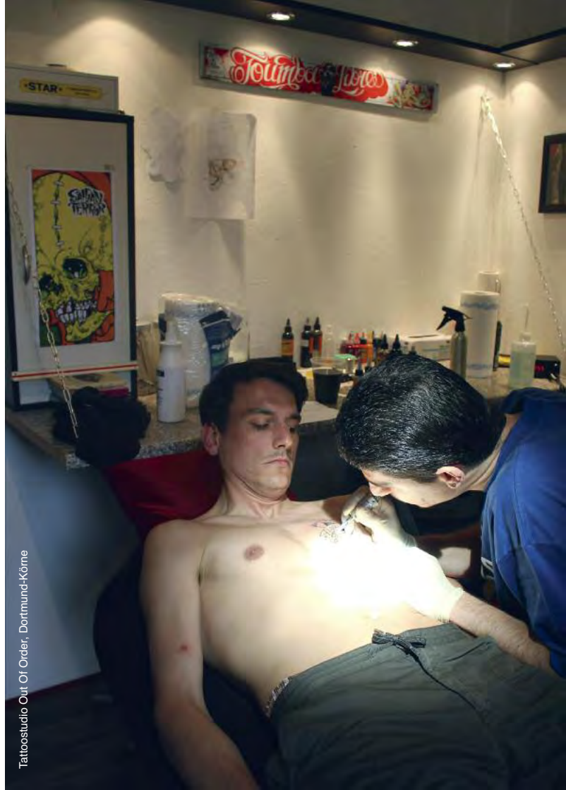
Tattoostudio Out Of Order, Dortmund-Körne