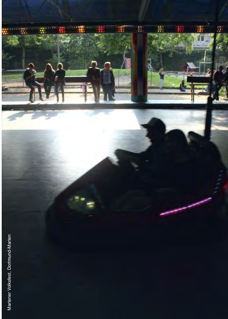
Martener Volkstest, Dortmund-Martener