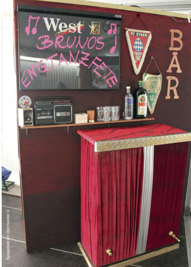
Spiegelzelt am Dortmunder U